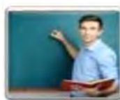
Un professeur مدرس